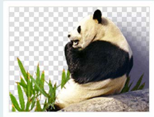
Shrunk transparent PNG File size: 15 KB